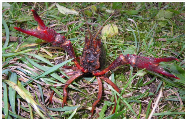
Ein amerikanischer Sumpfkrebs in Abwehrhaltung.

Besondere Aufmerksamkeit gilt sowohl dem Nördlichen Flusskrebs/Virilen Flusskrebs als auch dem Amerikanischen Rostkrebs/Rostflusskrebs, die beide innerhalb der EU noch nicht in der Natur nachgewiesen wurden.