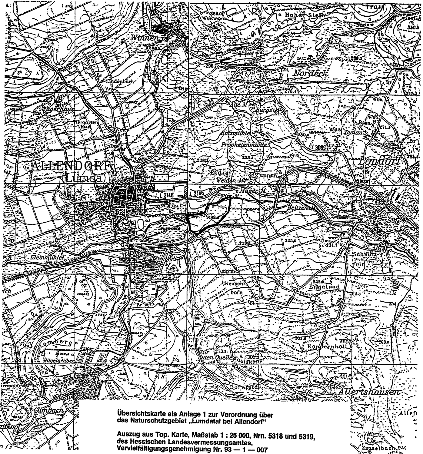
Übersichtskarte als Anlage 1 zur Verordnung über das Naturschutzgebiet „Lumdataal bei Allendorf“

Auszug aus Top. Karte, Maßstab 1 : 25 000, Nrn. 5318 und 5319, des Hessischen Landesvermessungsamtes, Vervielfältigungsgenehmigung Nr. 93 — 1 — 007